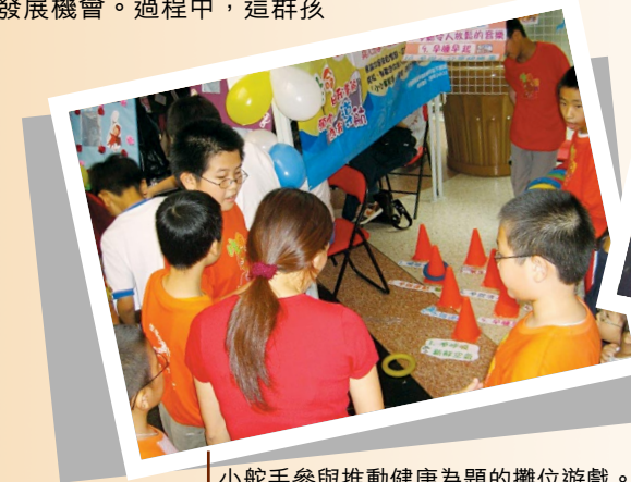
小舵手參與推動健康為題的攤位遊戲。Mentees participating in stall games which promote public health.

卓文是一名學生，最初參加「生命導航員計劃」是希望用生命影響生命，為一群來自低收入家庭的孩子擔當「生命導航員」，幫助孩子突破客觀環境的制肘，獲得平等的全人發展機會。過程中，這群孩