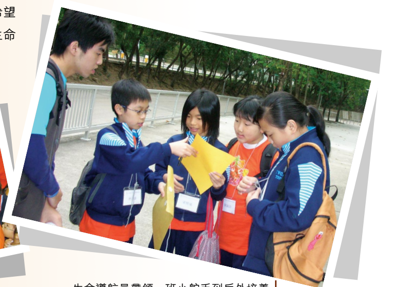
生命導航員帶領一班小舵手到戶外培養團隊精神及提升解決困難的能力。Mentors helped mentees build up team spirit and harness their ability of problem-solving through outdoor activities.

推行上述計劃的是東華三院賽馬會沙田綜合服務中心，中心得到「社區投資共享基金」撥款資助，於二〇〇五年十二月起舉辦這項名為「生命導航員」師友互動情繫社區校園計劃，目的是推動跨界別的合作與聯繫，建立社區互助網絡，為貧窮學童提供多方面的學習及發展機會，減少跨代貧窮的機會。